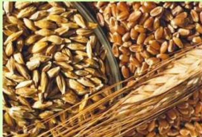
Ячмень и пшеница